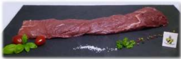
Bild: Wildschweinerücken ausgebeint € 28,-/kg. Auch wunderbar zum

Bis auf Schultern und Spareribs eignen sich alle bei uns erhältlichen Partien sowohl als kurzgebratenes Fleisch (z.B. Steaks), als auch als Braten. Damit macht es Ihre Verwendung sehr einfach. Ob Steak, Medaillon, Schnitzel, Roulade, Gulasch oder einen schönen Braten, Sie können alles mit unserem Wild kochen, grillen und braten. Normalerweise ist die Keule beim Reh hohl ausgebeint (Knochen kann einfach rausgezogen werden) und beim Wildschwein in Teile zerlegt. Unterschenkel und Knochen liegen für einen Fond bei. Rücken und Nackensteaks werden ausgebeint. Auf Wunsch sind auch immer einige Rücken am Knochen verfügbar. Ganze Tiere sind besonders günstig. Diese werden zerteilt (zerwirkt) fertig gemacht und kosten 5,-€/kg das Wildschwein und 7,-€/kg das Reh – jeweils mit Haut gewogen.