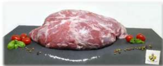
Bild: Wildschwein Keule € 15,-/kg für einen besonderen „Festtagsbraten“

Kurzbraten (z.B. Steak) und Grillen geeignet.